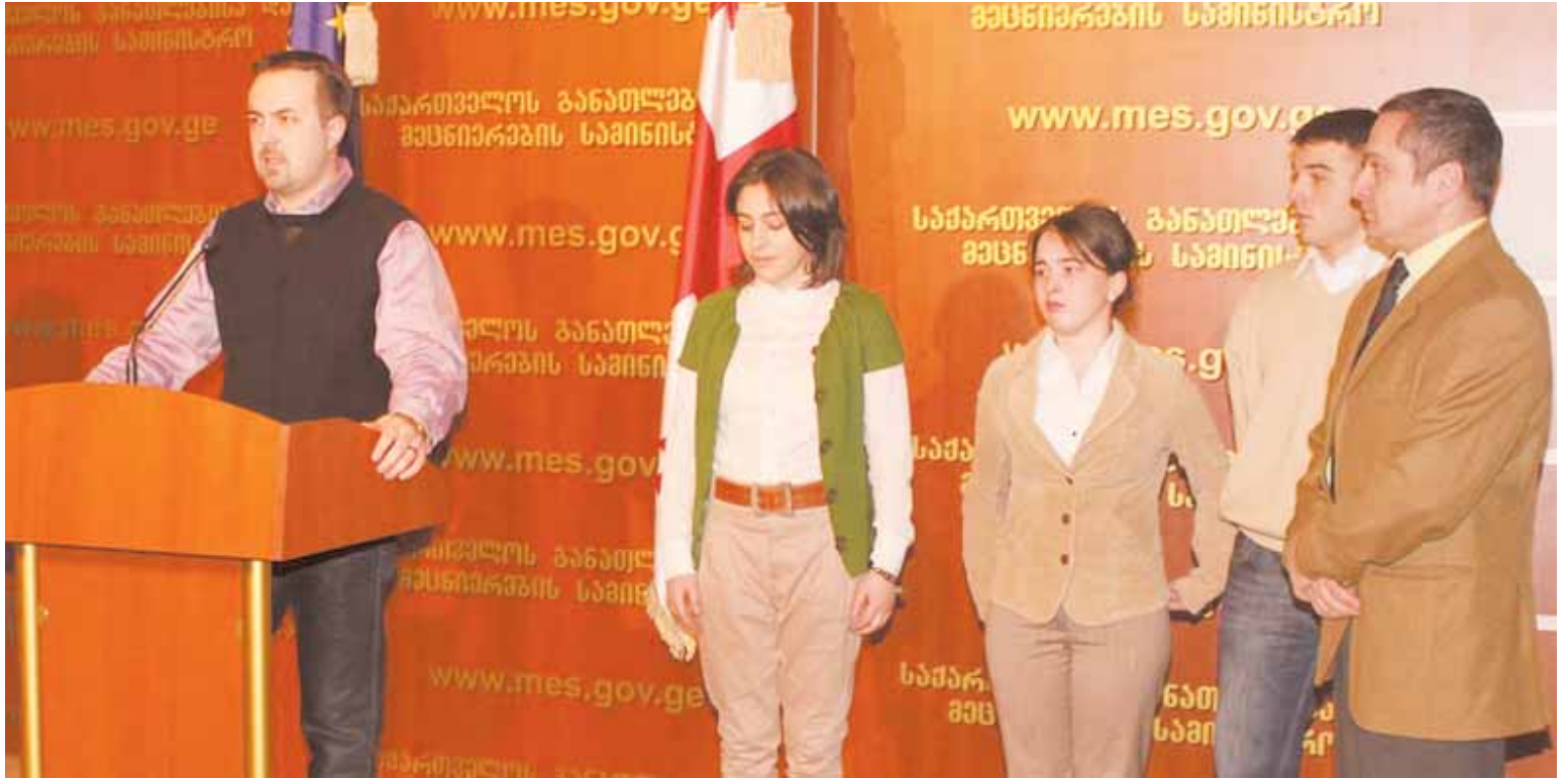
ჩეხეთი და ა.შ. გასულ წლებში საქართველო ამ კონკურსში აქტიურად მონაწილეობდა. კონკურსის მიზანია ნატოს პოპულარიზაცია, განსაკუთრებით - ახალგაზრდებში. ზაფხულში საქართველოში ასე

„ალიანტი“ ნატოსა და საერთაშორისო ურთიერთობების თემაზე ევროპაში ყველაზე წარმატებული საერთაშორისო კონკურსია. მასში საჯარო სკოლებისა და უმაღლესი სასწავლებლების 15-დან 19 წლამდე ასაკის ახალგაზრდები მონაწილეობენ. ფინალში გამარჯვებული გუნდები ნატოს წევრ სხვადასხვა ქვეყანაში იმოგზაურებენ, სამხედრო ბაზებს მოინახულებენ და თანატოლებს შეხვდებიან. კონკურსის მიზანია ჩრდილო-ატლანტიკური ალიანსის, უსაფრთხოებისა და საერთაშორისო ურთიერთობების შესახებ ცოდნის ამაღლება. აღსანიშნავია, რომ საქართველო ორი წელია საერთაშორისო კონკურსში ჩაერთო და ორივეჯერ გამარჯვება მოიპოვა. აქედან გამომდინარე, კონკურსის 10 წლის ისტორიის მანძილზე, 2010 წელს, საერთაშორისო