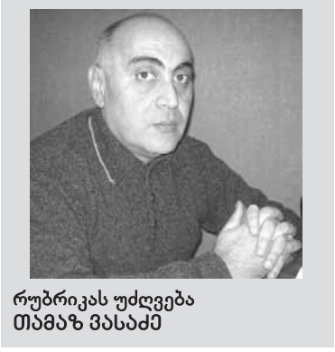
რუტიკას უშველაია თბილისის მუსიკალური სასახლის ხელმძღვანელი