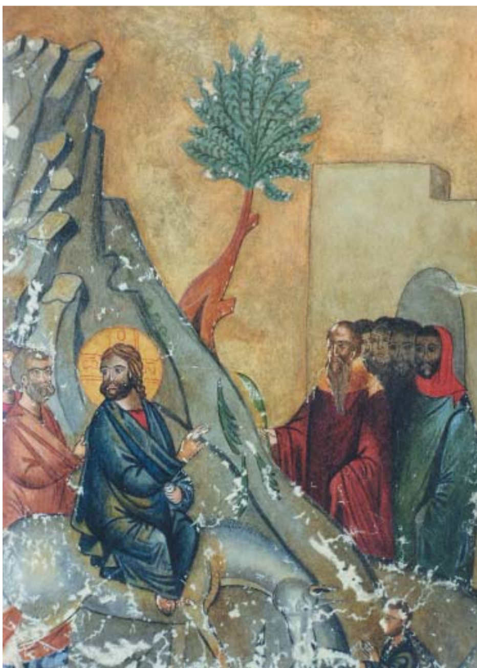
„ბზობა“ (ასლი). „გულანი“, XVI საუკუნე

2010 წლის 14 აპრილს, საქართველოს ფოლკლორის სახელმწიფო ცენტრის გალერეაში საქართველოს ეროვნული არქივის საცავებში დაცული კოლექციის – ძველი ქართული ხელნაწერი წიგნების, ისტორიული დოკუმენტების, მინიატურების მულაჟებისა და ფოლკლორის სახელმწიფო ცენტრის არქივის ხელნაწერი საგალობლების გამოფენა მოეწყო.