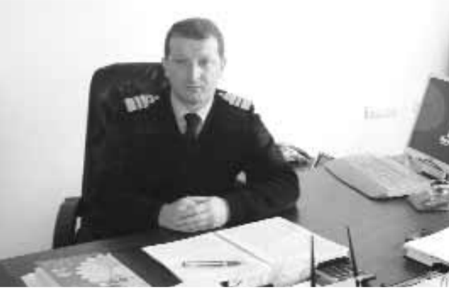
საზღვაო განათლება საპრემიუმო