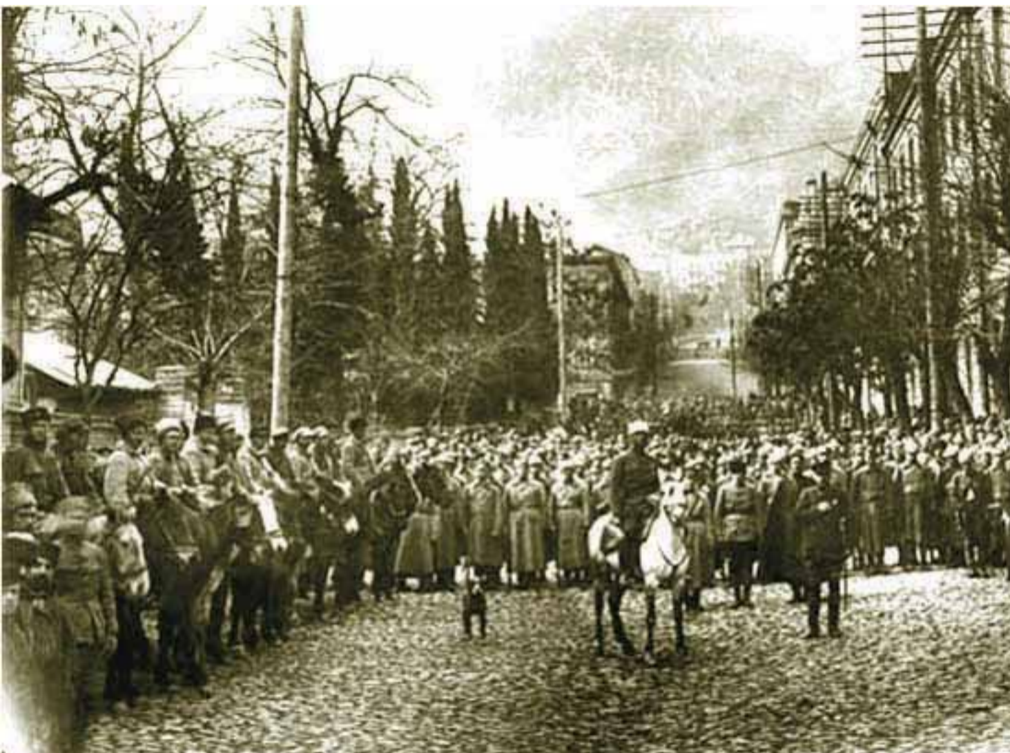
წითელი არმიის შემოსვლა თბილისში