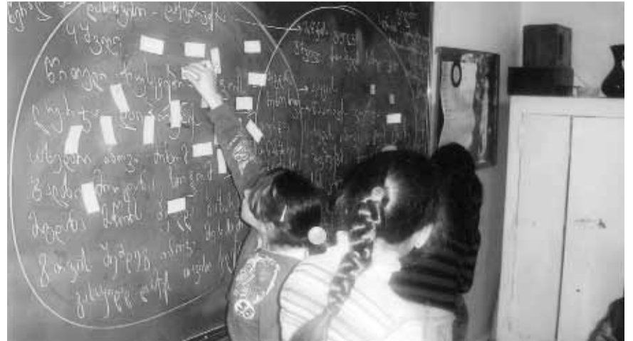
მოსწავლეები მუშაობენ ქართულ ენაში „მაგდანას ლურჯა“ თემაზე.