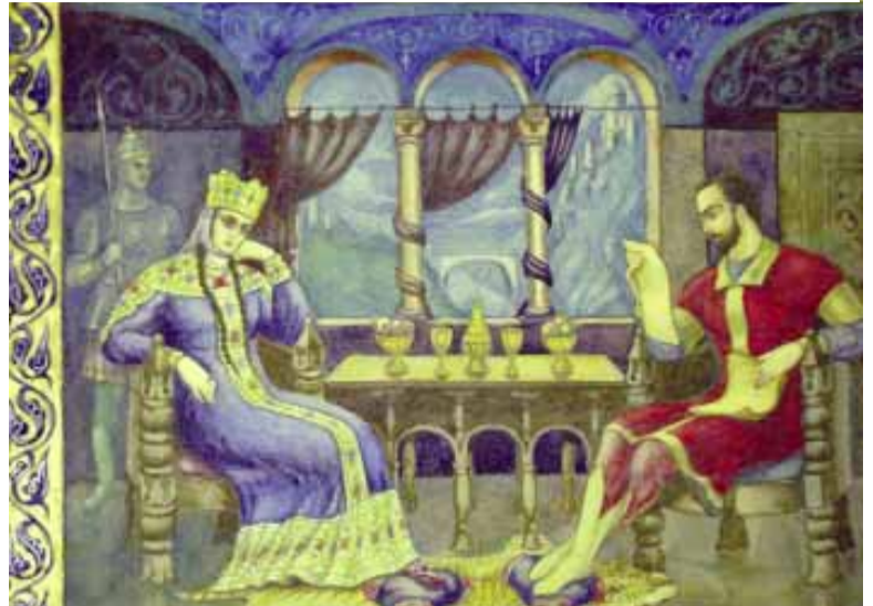
„ვეფხისტყაოსნის“ ილუსტრაცია, გიორგი ერისთავი

ამ უნიკალური კოლექციის გაცნობა მინდა ყველაზე მნიშვნელოვანით დავიწყო, ეს არის „ვეფხისტყაოსნის“ დღემდე უცნობი მინიატურები, რომელიც შესრულებულია ქართველი მხატვრის, გიორგი ერისთავის მიერ. ერთ-ერთი სცენა, სადაც შოთა რუსთაველი თამარ მეფეს „ვეფხისტყაოსანს“ უკითხავს, მნიშვნელოვანია იმით, რომ ფერები ძალიან ხალასი და ცოცხალია, გარდა ამისა, გამოყენებულია მინიატურები ძველი ქართული ხელნაწერებიდან, კერძოდ, მეთორმეტე საუკუნის თამარ მეფის სახარებიდან, ვანის ოთხთავიდან – გაფორმება ზუსტად არის გადმოტანილი. სცენაში შოთა რუსთაველი ცოტა უცნაური გარეგნობისაა, მაგრამ ვფიქრობ, ამ ილუსტრაციას უნდა იცნობდეს ქართველი საზოგადოება. გიორგი ერისთავის ნახატებს შორისაა, ასევე, შოთა რუსთაველის პორტრეტი, რომელიც შესრულებულია 1937 წელს ოქროს მედლით. ძვირფასია იმითაც, რომ მინიატურისთვის დაძველების სტილია გამოყენებული, თავსართი კი ზუსტად ასლით თამარ მეფის სახარებიდანაა გადმოტანილი. თავად მხატვარი იმითაა საყურადღებო, რომ ეპოქას არ გაურბის, ანუ, თუ თამარ მეფის ეპოქას ხატავს, იყენებს იმ პერიოდის ხელნაწერებს. როგორც ჩანს, განათლებული მხატვარი იყო, რადგან კარგად იცნობს ამ ეპოქას. მის ნახატებს შორისაა