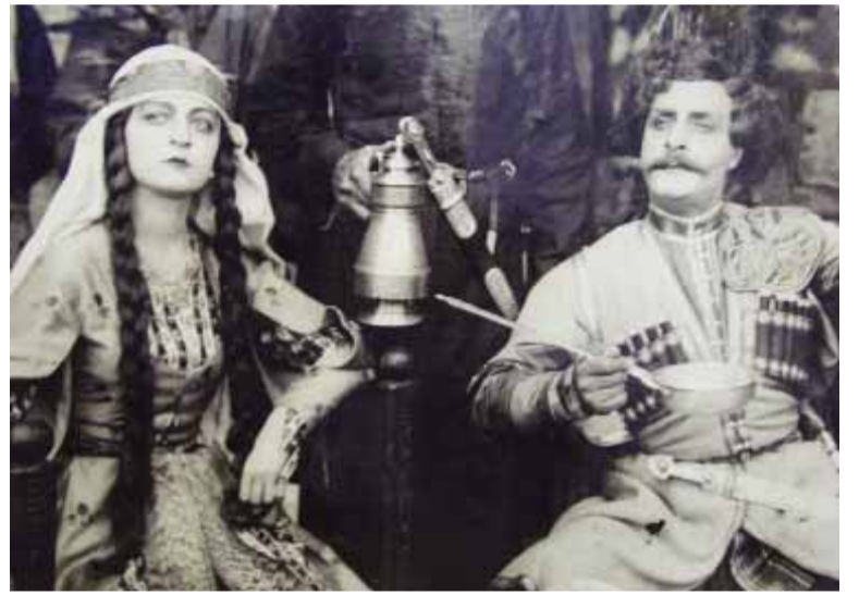
ჩუტა ერისთავი, სენა კინოფილიძე

ავტოპორტრეტი, ნახატი ქართულის დევიოპულის ნახატი – ქართულ ჩოხაში გამოწყობილი მიქელანჯელოს სტილია შესრულებული. ერთ-ერთ ნახატზე გამოსახულია კონსტანტინე ერისთავი – გიორგი ერისთავის მამა. ამ კოლექციის მარგალიტაა საფრანგეთის პრინცესას, სალომე დადიანის წერილი, მისივე ხელმოწერით. ასეთი მემკვიდრეობა ძალიან ცოტა შემორჩა, ეს ის პერიოდი, როცა სამეგრელოს დედოფალი ჯერ კიდევ ცოცხალია, საინტერესოა მისივე ხელმოწერით. ასეთი მემკვიდრეობა ძალიან ცოტა შემორჩა, ეს ის პერიოდი, როცა სამეგრელოს დედოფალი ჯერ კიდევ ცოცხალია, საინტერესოა მისივე ხელმოწერით. ასეთი მემკვიდრეობა ძალიან ცოტა შემორჩა, ეს ის პერიოდი, როცა სამეგრელოს დედოფალი ჯერ კიდევ ცოცხალია, საინტერესოა მისივე ხელმოწერით.