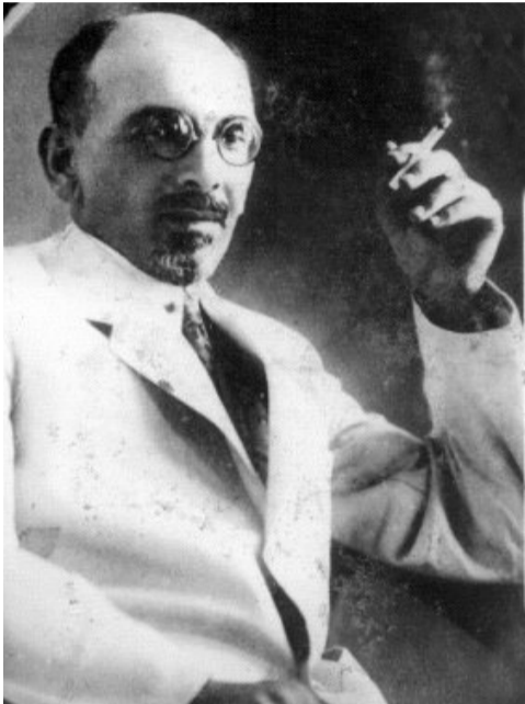
„ზის ბერძენი ტრაპიზონში და სტირის...“