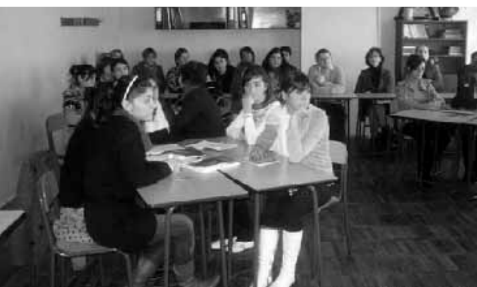
ნიკა გვარამიამ, ამავე დღეს, სკოლის 12 კურსდამთავრებული ოქროსა და ვერცხლის მედლებით დააჯილდოვა და, პრეზიდენტის ნაციონალური პროგრამის „ჩემი პირველი კომპიუტერი“ ფარგლებში, 5 წარჩინებულ მოსწავლეს პერსონალური კომპიუტერები გადასცა.

28 ნოემბერს თბილისის 92-ე საჯარო სკოლას განათლებისა და მეცნიერების მინისტრი ნიკა გვარამია, მინისტრის მოადგილეები - ირინე ქურდაძე, ნოდარ სურგულაძე და სამინისტროს სხვა წარმომადგენლები სტუმრობდნენ. ამ დღეს სკოლა 30 წლის იუბილეს ჩვეულ სამუშაო რიტმში აღნიშნავდა, „ლია კარის“ დღეზე მინიჭებულ სტუმრებს, საშუალება ჰქონდათ, თანამედროვე მეთოდებით დაგეგმილ გაკვეთილებს გაცნობოდნენ. ნიკა გვარამია დაესწრო მეთორმეტე კლასში გეოგრაფიის გაკვეთილს თემაზე - „მსოფლიოს გლობალური პრობლემები და მათი ურთიერთკავშირი“ და მოსწავლეებთან ერთად შემაჯამებელ დისკუსიაშიც მიიღო მონაწილეობა.