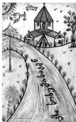
დავით ელარაძე, 8 წლის