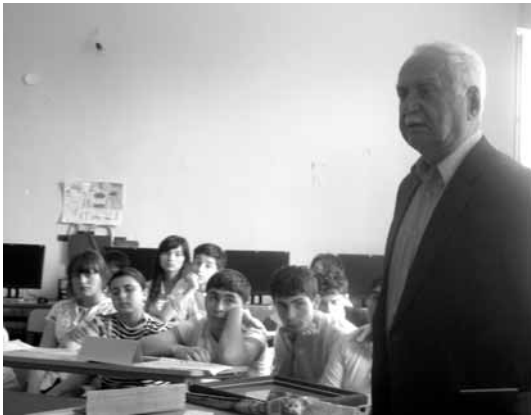
კმაყოფილი დარჩა – მსმენელიც და შემსრულებელიც.

გაკვეთილისთვის მზადების პროცესში ჩართული ყველა რესურსი, რისი გამოყენებაც საჭიროდ მიგვაჩნდა: საქმიანობა სკოლის ბიბლიოთეკაში და კომპიუტერების კაბინეტში გაკვეთილების შემდეგ; ვიდეოფილმებისა და ფოტოკოლაჟების მომზადება, ტაო-კლარჯეთში მოგზაურობის დროს მოპოვებული მასალები. გაკვეთილი უაღრესად დამაჯერებლად წარმოგვარდა. ეს იყო საინტერესო მასალით გაჯერებული ერთი საათი, რომლითაც ყველა