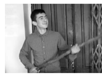
ბატონი სოფლის მეურნეობა