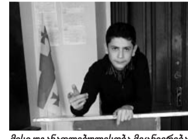
მისი უგანათლებლესობა მეცნიერება